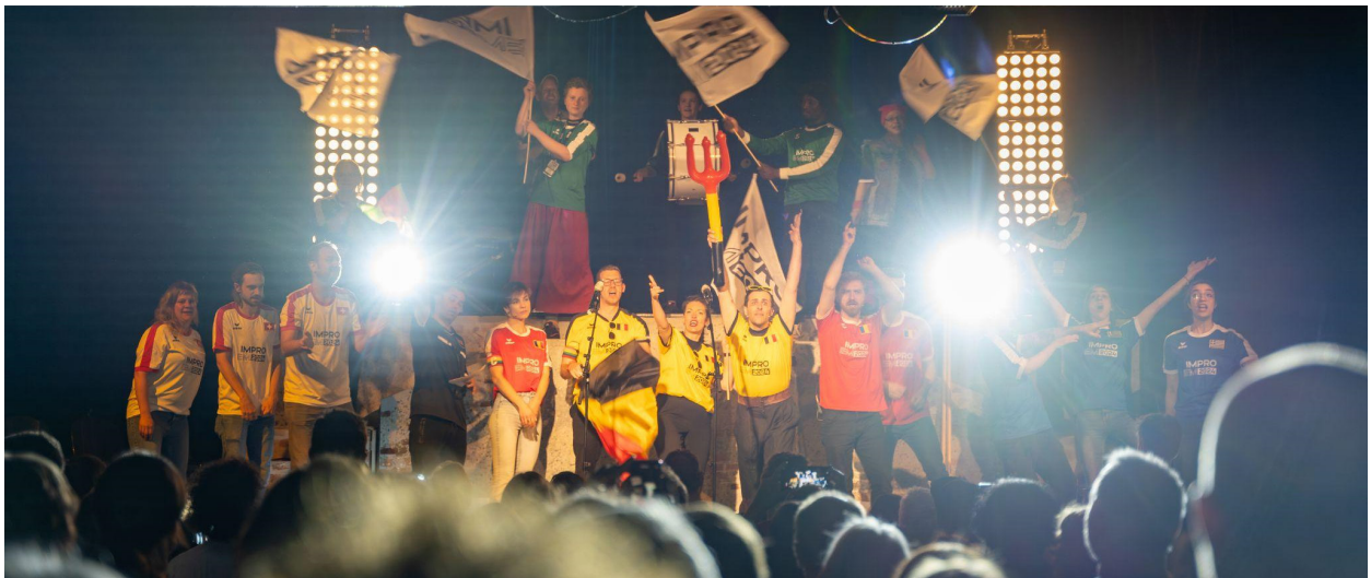
Münchner Theater für Kinder mit allen Teams.